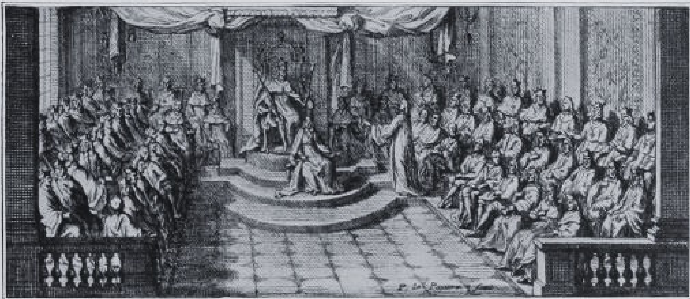
L'ASSEMBLÉE DU CLERGÉ DE 1682.

Gravure de Lepautre. Au fond, l'archevêque de Harlay, président; de part et d'autre, les 67 ecclésiastiques, membres de l'assemblée. A droite, un orateur, debout, prononce un discours. Décor d'architecture fantaisiste. — Bibl. Nat., Est. Qb.